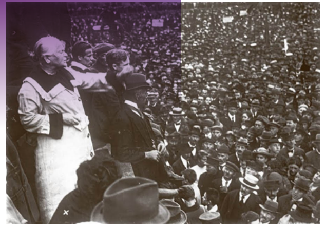
Discours de Clara Zetkin à un meeting en 1918

Nous le voyons, le marxisme offre de riches grilles de lecture qui permettent de penser nos conditions de vie et ouvrent des horizons plus larges qu'une déconstruction individuelle. Mais le féminisme marxiste, comme toute pensée marxiste, ne se limite pas à ces théorisations. Pour les marxistes, si la théorie est primordiale, l'objectif n'est pas de philosopher sans fin mais bien de se mettre en action. La théorie n'a de sens que dans son rapport à la pratique, les deux s'enrichissant. La force du marxisme, c'est de nous inviter à lutter pour renverser le rapport de force et de dessiner une autre société : le socialisme. Si les mouvements féministes ont souvent fait l'impasse de la question stratégique, le féminisme marxiste nous invite à nous poser sérieusement la question de comment renverser ce rapport de force.