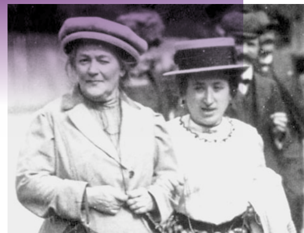
Clara Zetkin et Rosa Luxemburg en 1910

Plus que jamais, nous devons sortir des logiques d'entre soi en allant à la rencontre des personnes qui ne sont pas encore sûres de pourquoi le capitalisme nuit aux travailleuses et aux travailleurs. Nous devons également proposer des outils d'organisation collective – comme le syndicat – aux personnes qui veulent lutter contre le gouvernement Arizona, mais ne savent pas comment. Les mouvements sociaux sont des moments cruciaux. Face à la montée des discours réactionnaires et à la radicalisation du capitalisme, le féminisme marxiste nous offre une boussole essentielle. Il nous invite à analyser mais surtout à lutter collectivement, à intensifier les mouvements féministes et à obtenir des victoires.